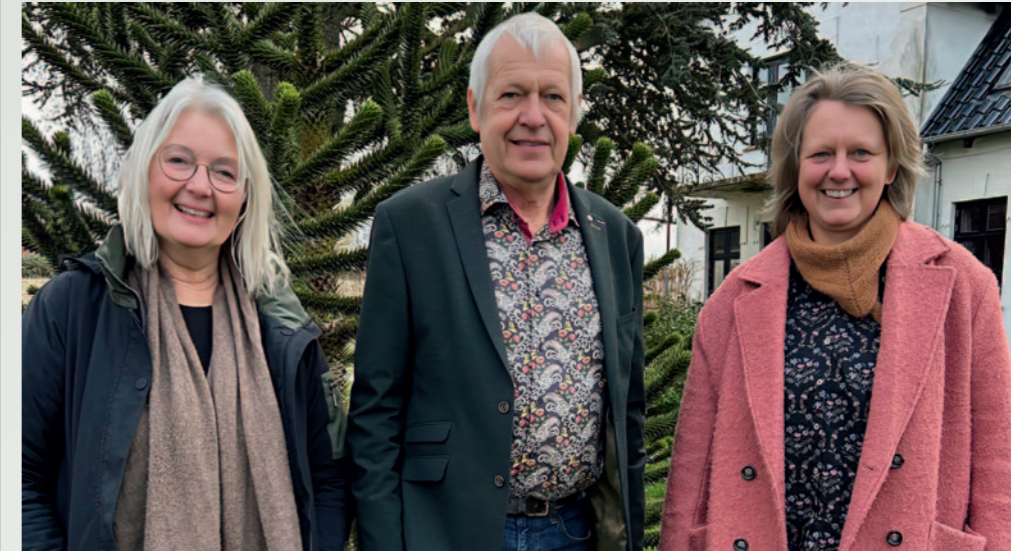
TAK til Rotary klubben i Ebeltoft, som i efteråret 2025 donerede kr. 5.000,- til julehjælpen

Pengene er en del af overskuddet fra salget af æbleskiver i klubbens æbleskivebod under sidste års Ebelfestival.