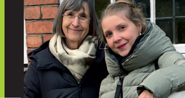
1. PASSIONSKONCERT, søndag 15. marts