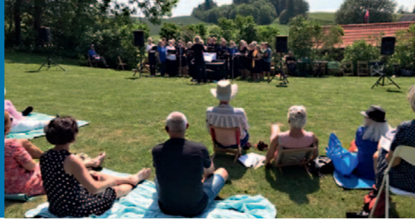
Familiegudstjeneste, anden pinsedag 25. maj