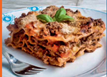
FORÅR med Gud, onsdag 6. maj