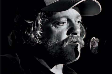
Fortællekoncert, torsdag 23. april