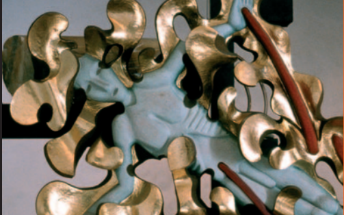
Bjørn Nørgaards alter fylder 25 år, søndag 26. april