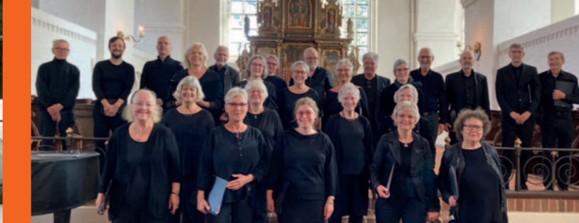
3. TRINITATISKONCERT, søndag 31. maj