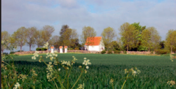
Pilgrimsvandring, mandag 6. april, fredag 1. maj, tirsdag 5. maj og torsdag 11. juni