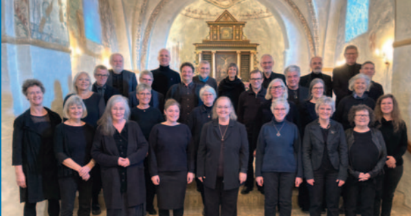
Befrielsesgudstjeneste med Mols-Helgenæs Kantori, søndag 4. maj