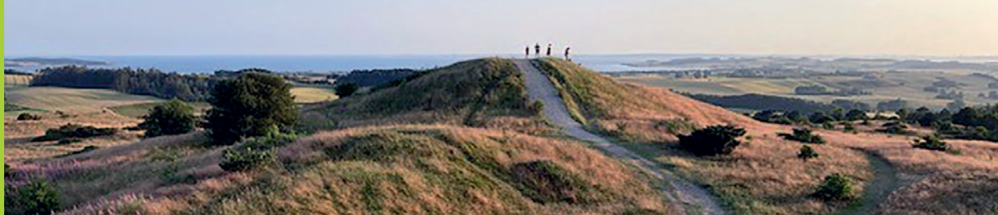
Pilgrimsvandring, torsdag 1. maj, torsdag 5. juni, torsdag 3. juli og Fredag 11. juli