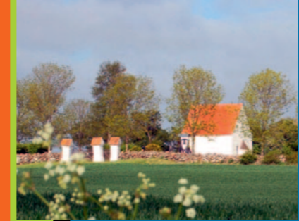
Sankt Hans-gudstjeneste, mandag 23. juni