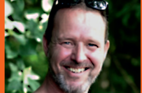
Tvivl, tro og gakkede gangarter, onsdag 26. marts