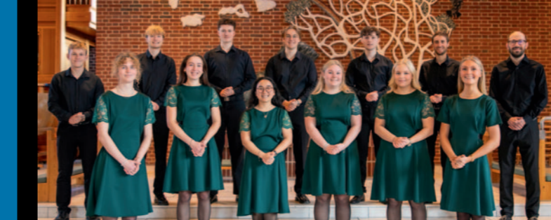
Korkoncert med ungdomskoret Vestklang, Søndag 1. juni