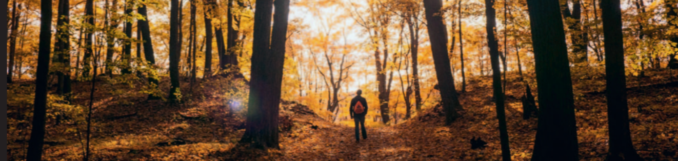
Pilgrimsvandring, fredag 25. november, fredag 2. december, søndag 18. december, fredag 3. februar, fredag 3. marts og søndag 19. marts