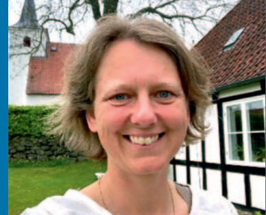
Når straf bliver til omsorg, onsdag 25. januar