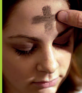
Andagt og askeonsdag, onsdag 22. februar