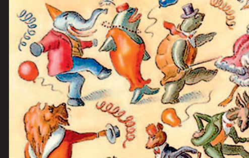
Dyrenes Karneval af Camille Saint-Saëns, søndag 29. januar