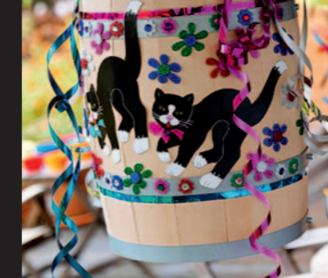
Fastelavns- og familiegudstjeneste med Spirekoret, søndag 19. februar