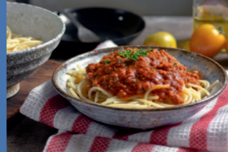
Spaghettigudstjeneste, onsdag 1. februar og onsdag 1. marts