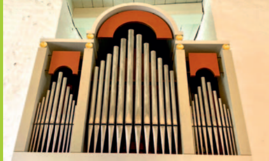
Kyndelmissegudstjeneste, torsdag 2. februar