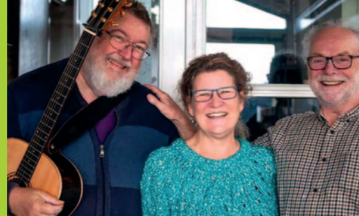
Jazzgudstjeneste, søndag 12. februar