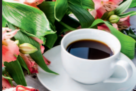
White Friday, fredag 25. november