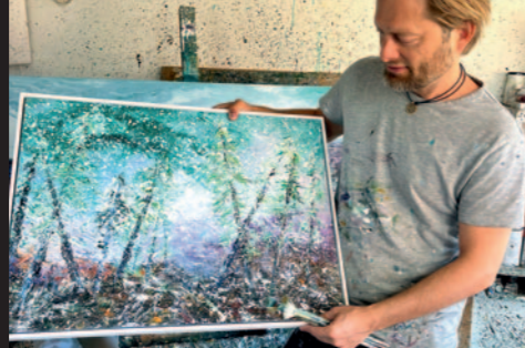
Troen og naturen – naturens skønhed trækker himlen ned til os, onsdag 8. marts